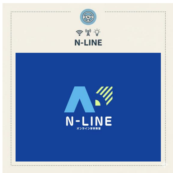
オンライン学科教習アプリ N-LINE